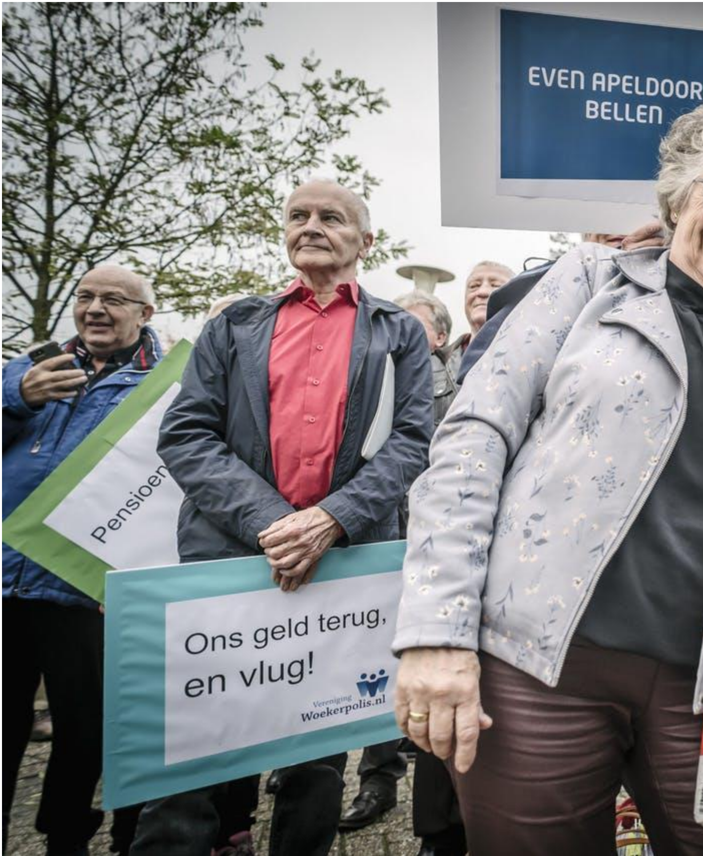
Geduceerden voeren actie op het terrein van verzekeraar Achmea .