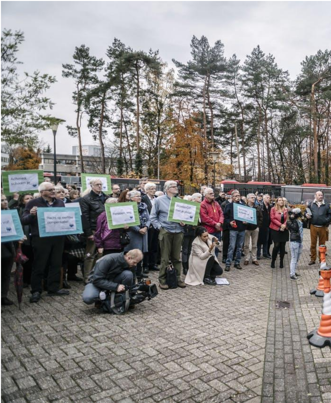
Als Achmea geen gehoor geeft, dreigen de belangenclubs met een gang naar de rechter, Foto: Erik van 't Woud voor